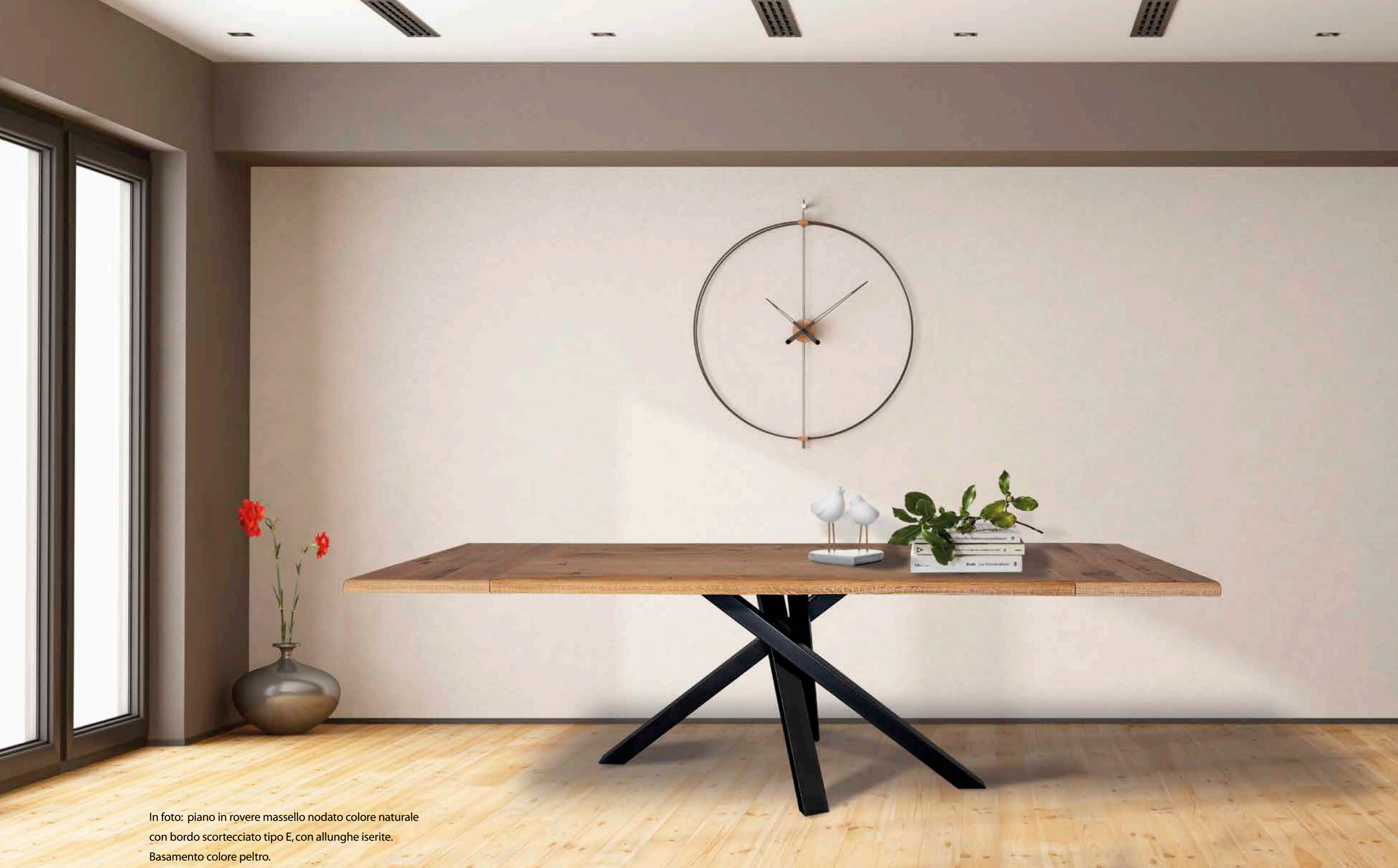
In foto: piano in rovere massello nodato colore naturale con bordo scortecciato tipo E, con allunghe iserite. Basamento colore peltro.