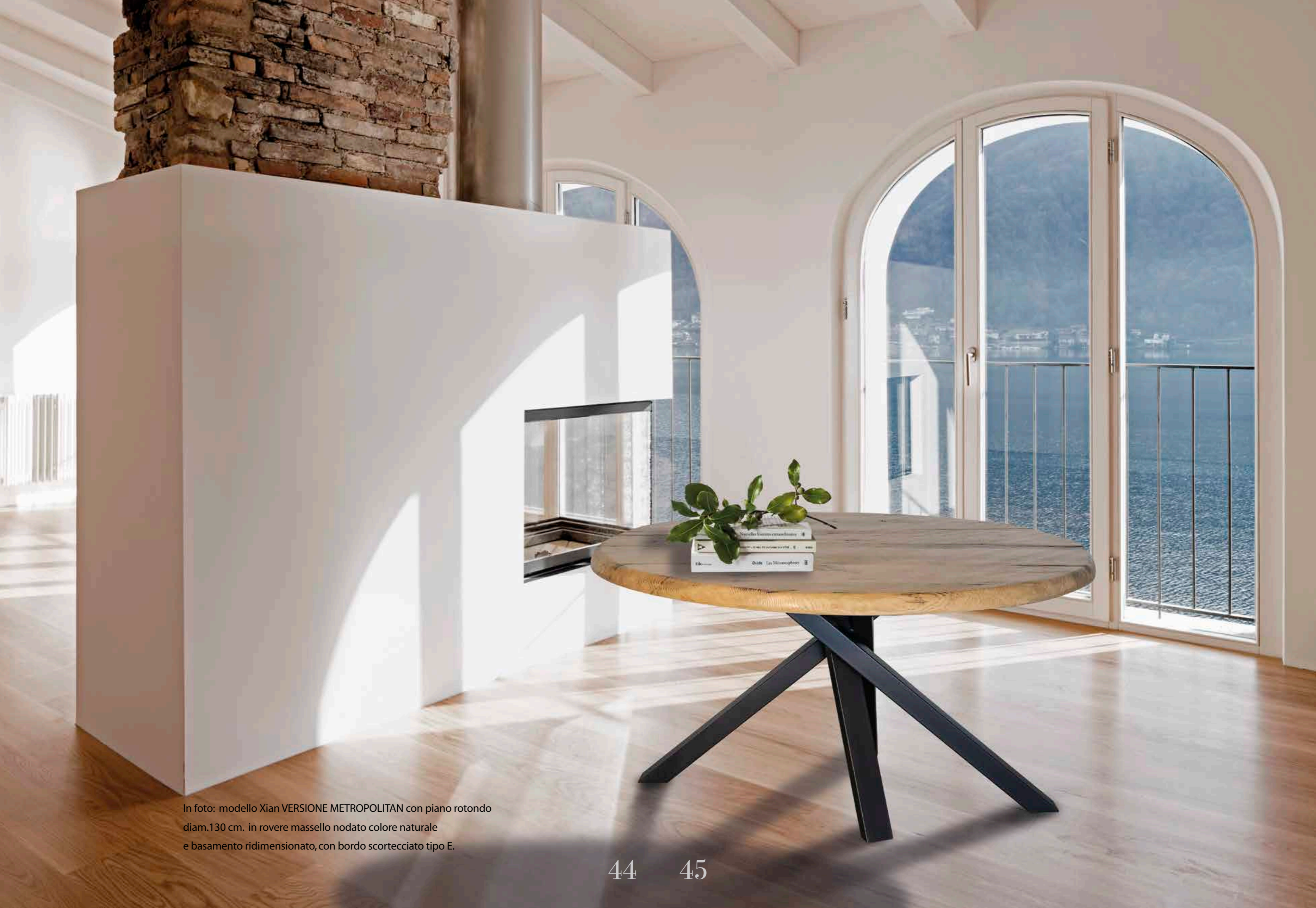
In foto: modello Xian VERSIONE METROPOLITAN con piano rotondo diam.130 cm. in rovere massello nodato colore naturale e basamento ridimensionato, con bordo scortecciato tipo E.