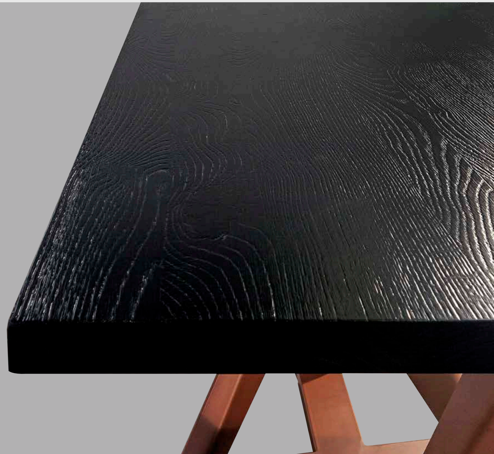
Particolare del piano in rovere nodato placcato bordo foglia squadrato tipo A.