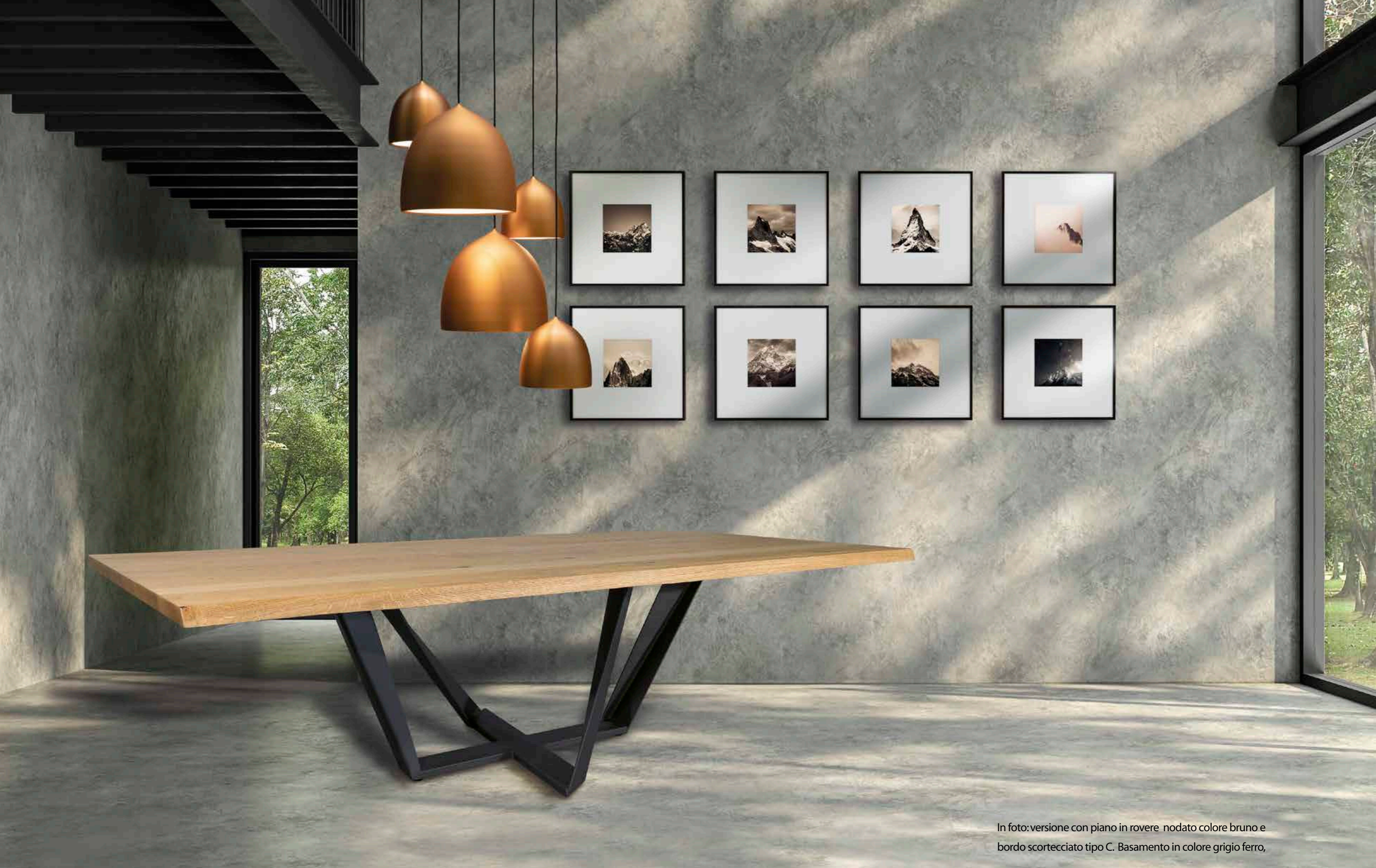
In foto: versione con piano in rovere nodato colore bruno e bordo scortecciato tipo C. Basamento in colore grigio ferro,